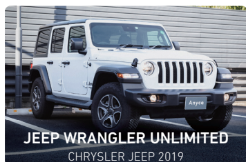
JEEP WRANGLER UNLIMITED CHRYSLER JEEP 2019