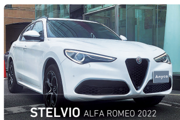
STELVIO ALFA ROMEO 2022