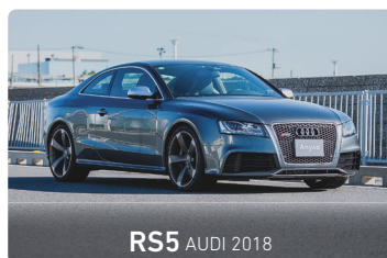
RS5 AUDI 2018