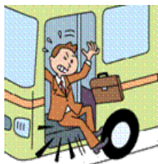
バスのステップでケガ

日本国内または国外において、所定の交通乗用具との衝突、接触等の交通事故または交通乗用具に搭乗中の事故によりケガをされた場合等に、保険金をお支払いします。(交通乗用具の詳細はP14参照)