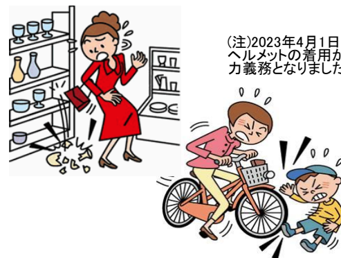
(注)2023年4月1日よりヘルメットの着用が努力義務となりました。