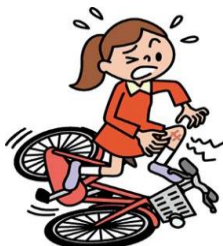
自転車で転倒してケガ