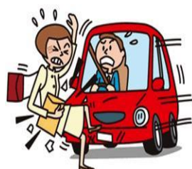
車にはねられてケガ