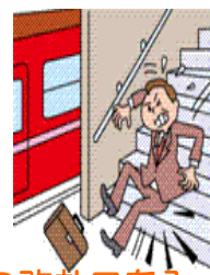
駅の改札口を入ってから改札口をでるまでのケガ