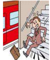
駅の改札口を入ってから改札口をでるまでのケガ