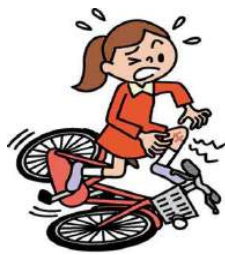
自転車で転倒してケガ