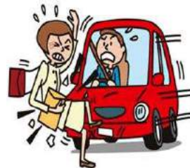
車にはねられてケガ