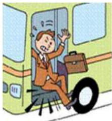
バスのステップでケガ

日本国内または国外において、所定の交通乗用具との衝突、接触等の交通事故または交通乗用具に搭乗中の事故によりケガをされた場合等に、保険金をお支払いします。(交通乗用具の詳細はP14参照)