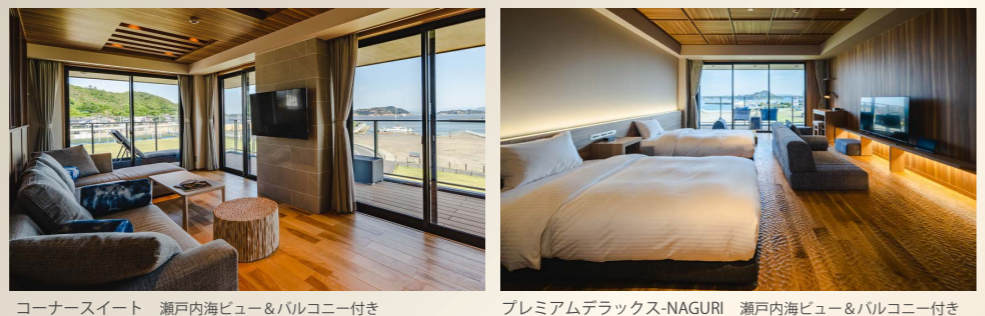
コーナースイート 瀬戸内海ビュー&バルコニー付き プレミアムデラックス-NAGURI 瀬戸内海ビュー&バルコニー付き

ナチュラルモダンをベースに、瀬戸内の海、倉敷・児島のデニムを連想させる青をアクセントカラーとしたデザインで、随所に岡山らしい要素をモチーフとして取り入れています。また、瀬戸内レストランBLUNOでは瀬戸内の新鮮な食材を存分に生かし、見た目も味にもこだわった、カジュアルに楽しめる新しいフレンチコースをご用意しております。