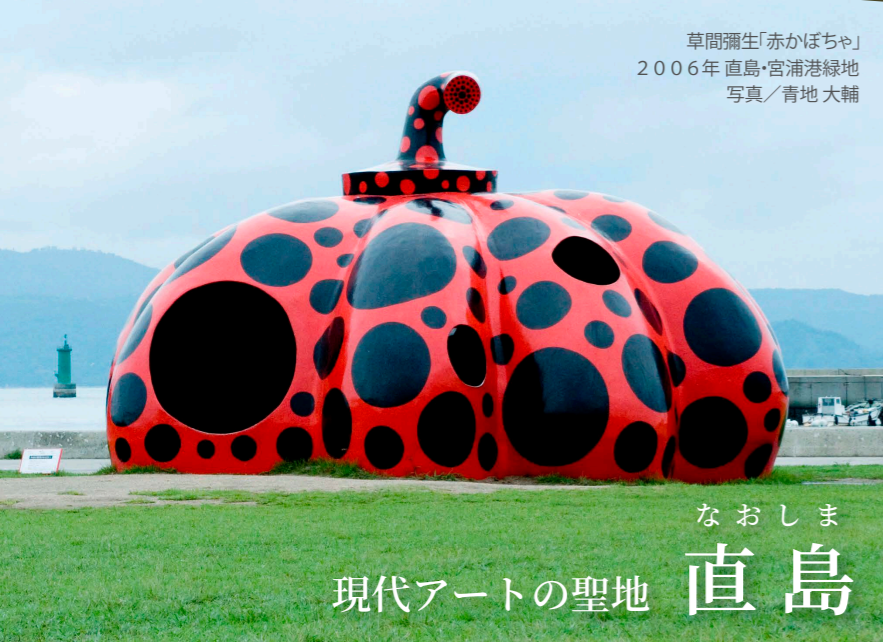
草間彌生「赤かぼちゃ」 2006年直島・宮浦港緑地