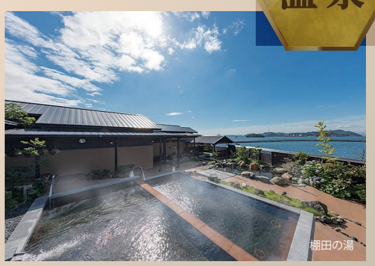
※温泉タイプ：天然温泉（加温・循環ろ過）

それぞれ趣の異なる露天風呂「沢の湯」「棚田の湯」をはじめ、岩盤浴、サウナなどがあり建物は庄屋造りの雰囲気、素朴で穏やかな時間が流れる非日常的な空間を楽しめます。