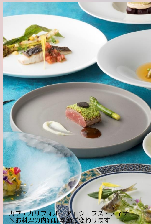
「カフェカリフォルニア」シェフズ・ディナー ※お料理の内容は季節で変わります